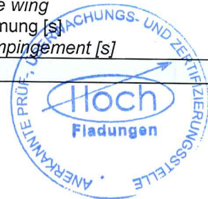
Tabelle / table 2: Prüfergebnisse der SBI Prüfungen / SBI test results